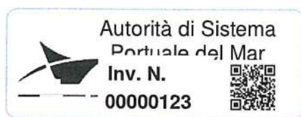
Esempio Fronte etichetta beni