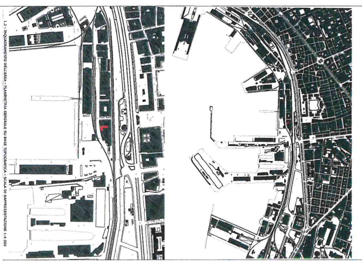
1.2 - INQUADRAMENTO DEL CANTIERE - MANIFESTA GENERALE SU BASE TOPOGRAFICA - STATO DI RAPPRESENTAZIONE 1:4.000